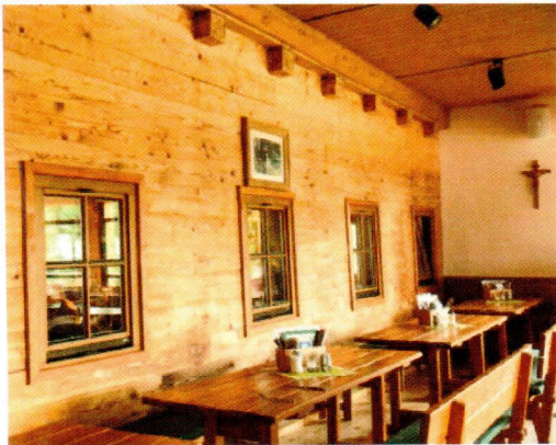
Durch die Umbauung der Terrasse wurde ein neuer attraktiver Raum geschaffen.