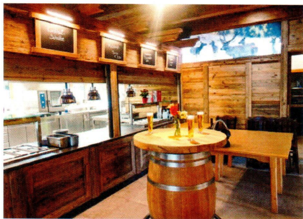
Der Neubau brachte dem Team auch eine offene, moderne Küche.

Denn auch in der Höhe zeigt die Familie, dass sich ihre Mitglieder den höchsten gastronomischen Anforderungen gewachsen zeigen. Die Qualität der Gastfreundschaft hat sich längst weit herumgesprochen, sieben- bis achthundert Gäste sind an schönen Tagen keine Seltenheit. Dabei zählen nicht unbedingt Sonn- und Feiertage zu den am stärksten frequentierten Terminen. Hochbetrieb herrscht zum Beispiel am Montag, an dem als Spezialität „Hüttschnitzel mit Erdäpfelsalat“ auf der Tageskarte steht. Ein